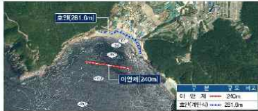
감지해변 정비 계획

(부산=연합뉴스) 박창수 기자 = 부산해양수산청은 부산 영도 감지2지구에 태풍 피해를 막기 위한 연안정비 사업을 추진한다고 8일 밝혔다.