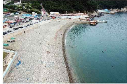
부산 영도구 감지해변.