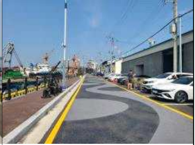
▲ 보도 확장 및 재포장