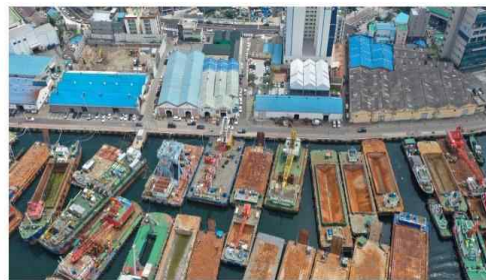
부산영도구 봉래동 부산대교 하부부터(대선조선까지) 봉래, 루로 600m 구간 커피특화거리로 다시 태어난다. 봉래동 물양장 봉애-루로 일대를 하늘에서 내려다본 모습이다. (촬영:정승희 기자)@