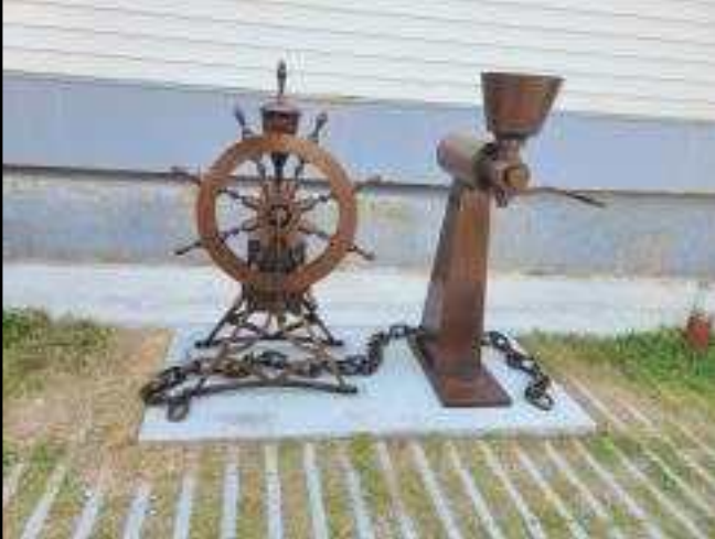
▲ 조형물 설치