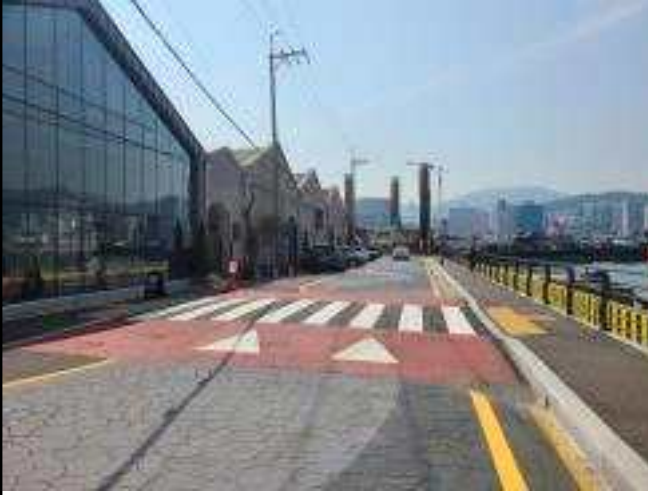
▲ 보도 확장 및 재포장