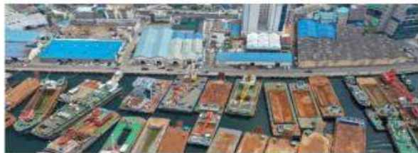
부산 영도구 봉래동 부근에 위치한 대천조선기지 봉래나루로 600m 거리가 조성된 커피특화거리로, 다채로운 바다를 볼 수 있는 봉래동 물양장 인근에 조성된다. 내리다보-오송이다.

부산 영도구 봉래동 물양장 거리가 부산을 대표하는 커피특화거리로 거듭난다. 전포커피거리, 온천커피거리와 함께 부산을 대표하는 또 하나의 커피거리가 탄생했다. 부산시는 골짜기와 창고의 모습이 들어선 산업 공간이었던 봉래나루로 커피를 마시며 걸기 좋은 공간으로 꾸민다.