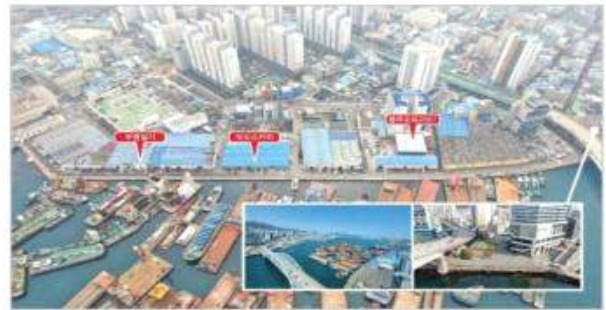
[부산=뉴스1]영도 커피특화거리 조성위치(좌측=부산시 해운·관광과, 우측=대천조선) [포항=뉴스1]

영도구 봉래동 물양장 인근 봉래나루로 600m 구간 시비 8억5천만 원 투입, 8월 공사 착수 연내 조성 완료