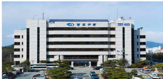
[부산=뉴스시] 부산 영도구청. (사진=영도구 제공) *재판매 및 DB 금지

[부산=뉴스시]권태은 기자 = 부산시 영도구는 올해부터 출산지원금을 500만원으로 확대 실시한다고 4일 밝혔다.